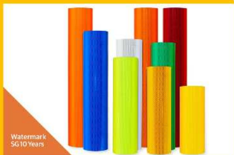
Watermark SG10 Years

Cumple normas: ASTM D4956 Type 9, KS T 3507 Type 9, AS/NZS 1906.1:2017 Class900, JIS Z 9117 Type 2-A-a & 2-A-b