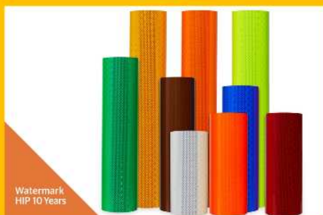
Watermark HIP 10 Years

Cumple normas: ASTM D4956 Tipo 4, KS T 3507 Tipo 4, AS/NZS 1906.1:2017 Clase 400, EN12899-1 Clase RA2, GB/T 18833 Clase 4, GOST 32945 Clase 2, JIS Z 9117 Tipo 2-A-a y 2-A-b