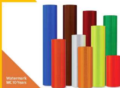
Watermark MC10 Years

Cumple normas: ASTM D4956 Type 11, KS T 3507 Type 11, AS/NZS 1906.1:2017 Class 1100, EN 12899-1 Class RA2, JIS Z 9117 Type 2-A-a & 2-A-b, GB/T 18833 Class 5